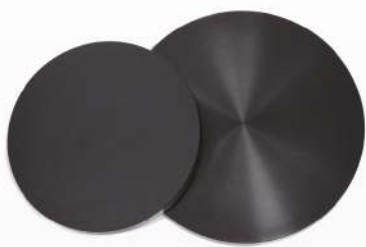
Рабочий диск тонкой шлифовки