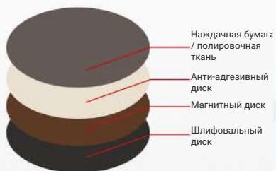
Магнитная шлифовально-полировальная система (опционально)