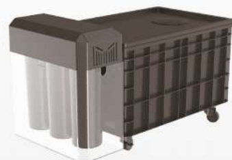
Водяной бак циркуляции и фильтрации шлифовально-полировального станка (опционально)