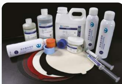
Шлифовально-полировальные расходные материалы