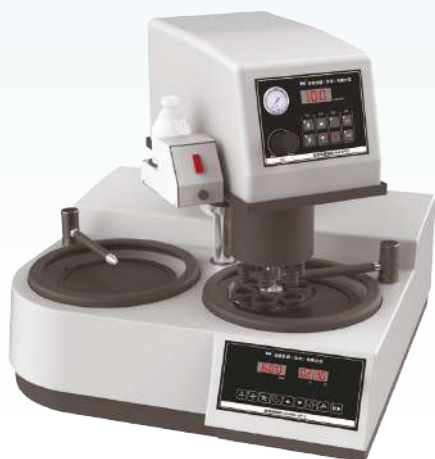
Двухдисковый полностью автоматический шлифовально-полировальный станок AutoPOL GP-2A

Двухдисковые полностью автоматические шлифовально-полировальные станки