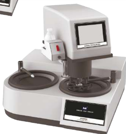
Двухдисковый полностью автоматический шлифовально-полировальный станок AutoPOL GP-2AT

Двухдисковые полностью автоматические шлифовально-полировальные станки AutoPOL GP-2A/2AT объединяют в себе функции предварительной шлифовки, шлифовки и полировки металлографического шлифа и прочие функции, характеризуются высокой мощностью, низким шумом, прочностью и долговечностью, оснащены полностью автоматической шлифовально-полировальной головкой, что значительно снижает интенсивность труда, они просты в работе, представляют собой идеальные шлифовально-полировальные станки для предприятий и научно-исследовательских институтов.