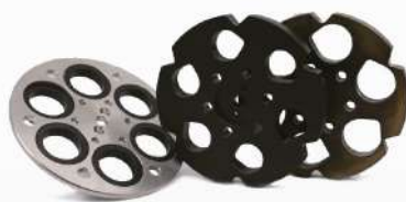
Автоматический дозатор (справочное изображение, реальное изделие немного отличается)