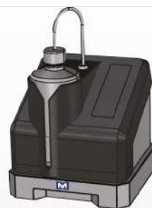
Легко заменяемая пластиковая подкладка