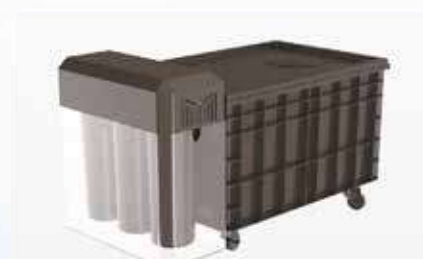
Водяной бак циркуляции и фильтрации шлифовально-полировального станка (опционально)