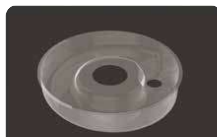
Легко заменяемая пластиковая подкладка