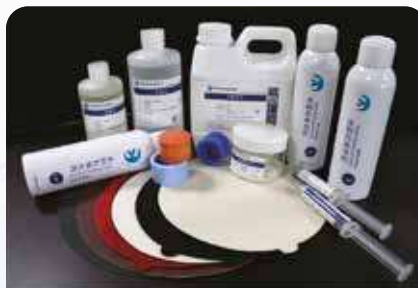
Шлифовально-полировальные расходные материалы