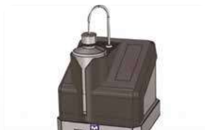
Автоматический дозатор (справочное изображение, реальное изделие немного отличается)