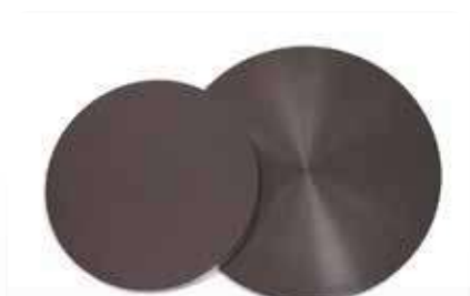
Рабочий диск тонкой шлифовки