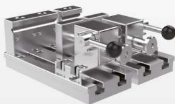
Быстродействующий зажим из нержавеющей стали 304