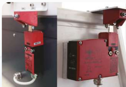
Аварийный выключатель «Шнейдер Электрик» (слева: стандартная комплектация / справа: опционально)