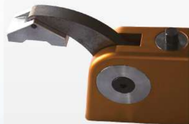
Вертикальный зажим (опционально)