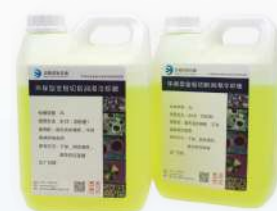
Охлаждающая жидкость (смазочно-охлаждающая жидкость)